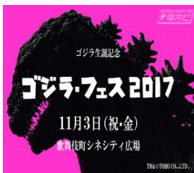
↑ ①ゴジラフェス Godzilla festival Festival for all Godzilla lovers

Japanese traditional culture, art and music