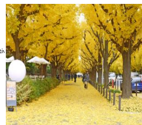
↓ ④神宮いちよう祭り ginkgo festival

You must see this beautiful Ginkgo trees