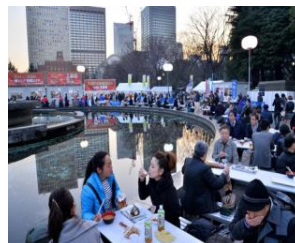
↑ ③フィッシャーマンズフェスティバル Fisherman's festivi You can enjoy japanese traditional fish meals

You must see this beautiful Ginkgo trees