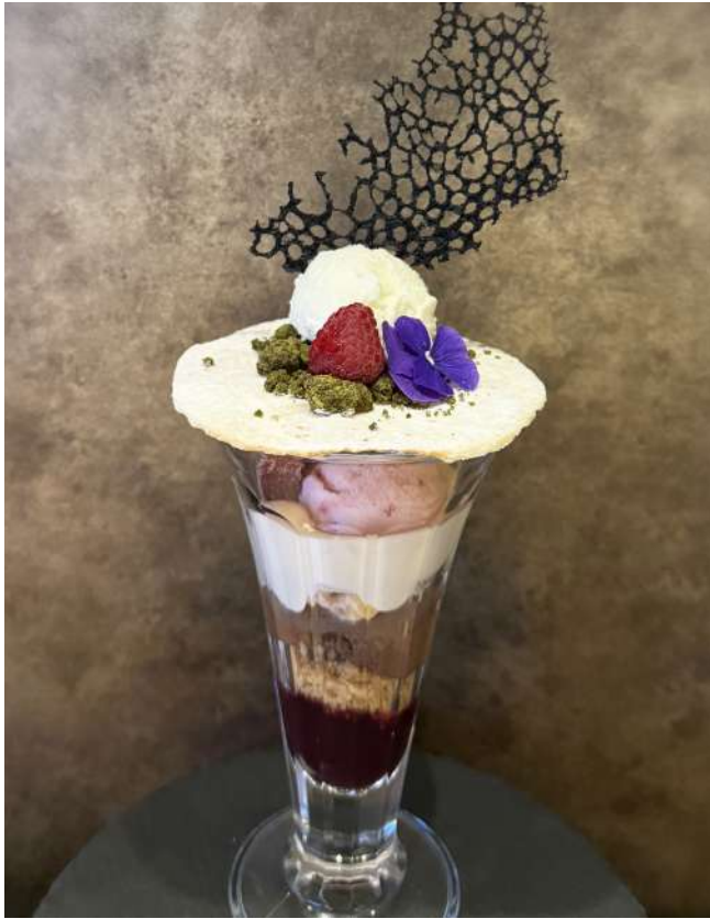
パフェ ド イヴェール ~ベリーとショコラ~ Winter Parfait ~Berry and Chocolate~