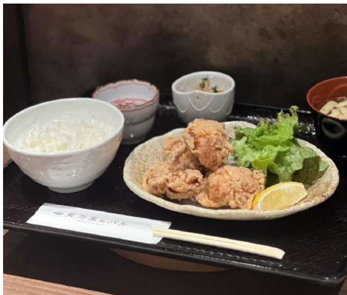
自家製タレザンギ定食 Homemade sauce zangi set meal

実乃里の週替わりランチ ¥1050 今週の内容についてはスタッフにお聞きください。